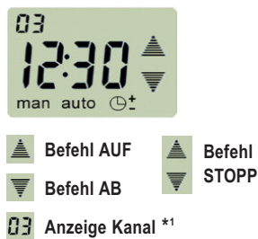
(Abb. 2) LCD-Display: